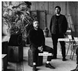
All rights reserved

Des projets marqués Une table en chêne et acier leur vendent chez Merci . Un deuxième projet : la boutique Aesop rue Vieille-du-Temple. Puis la boutique Isabel Marant qui entraîne l'agence à l'international avec une posture délicate dans une collaboration classique entre un architecte et un constructeur. Puis Paulin , une boulangerie logements à Lago-Cap-Ferrat. Le bâtiment présente une structure en béton banché et bois massif avec un bardage en panneaux de Douglas traité. Ce souci du matériau, encore, et du détail : « Nous avons travaillé sur le bâtiment jusqu'à l'intérieur de l'agence. Le projet total ». Le Gradium , un grand magasin incarné à Havre-Caumartin, à Paris. Confrontement au goût du manager du lieu, un studio de radio a été aménagé à l'intérieur, qui ressemble alors à un DJ Booth.